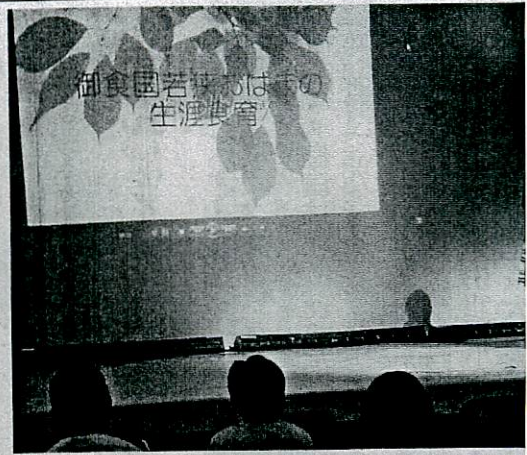
小浜市の食育に関する取り組みを紹介する さん＝静岡市葵区