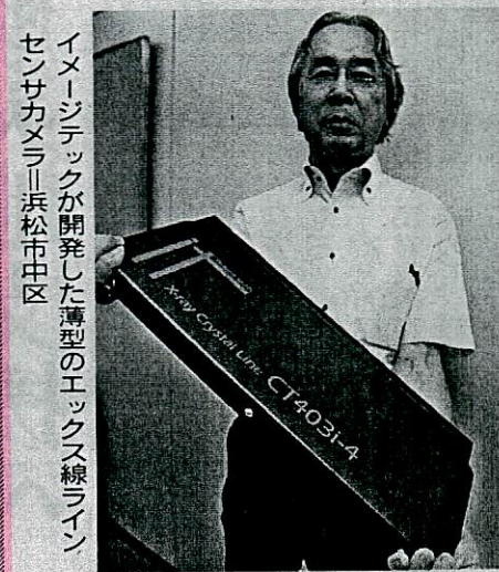
イメージテックが開発した薄型のエックス線ライン センサカメラ＝浜松市中区